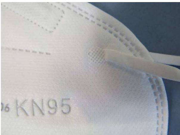
Bild 5 Anbindung der Kopfbänderung