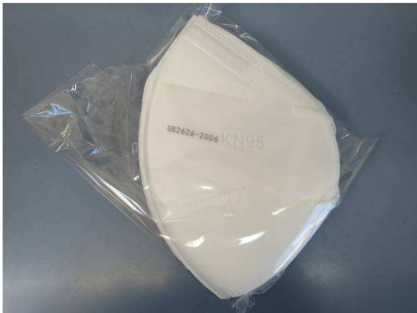
Bild 3 Einzelverpackung