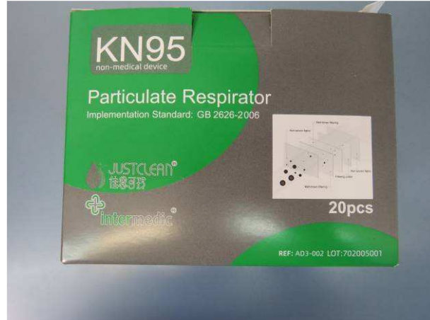
Bild 2 Verpackung der Probekörper