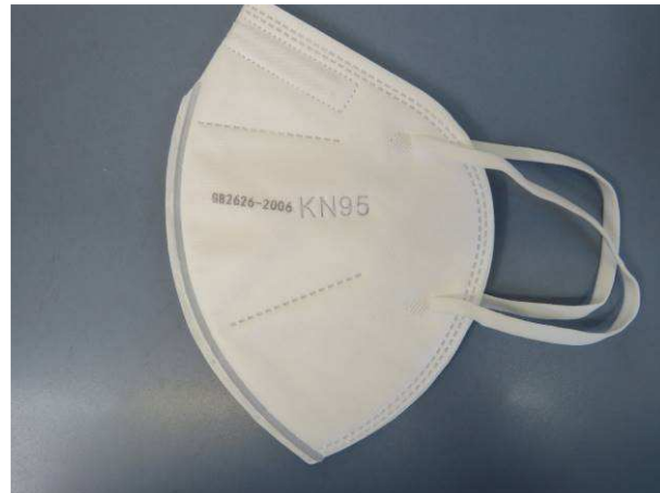
Bild 4 Ansicht des Probekörpers