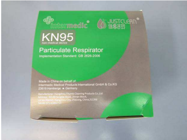
Bild 1 Verpackung der Probekörper